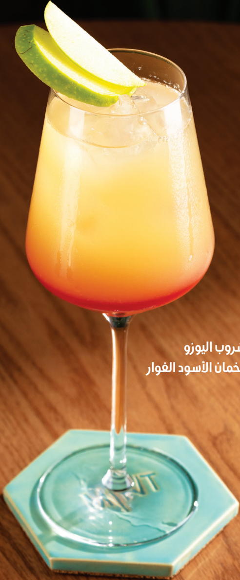
مشروب اليوزو والخمان الأسود الفوار