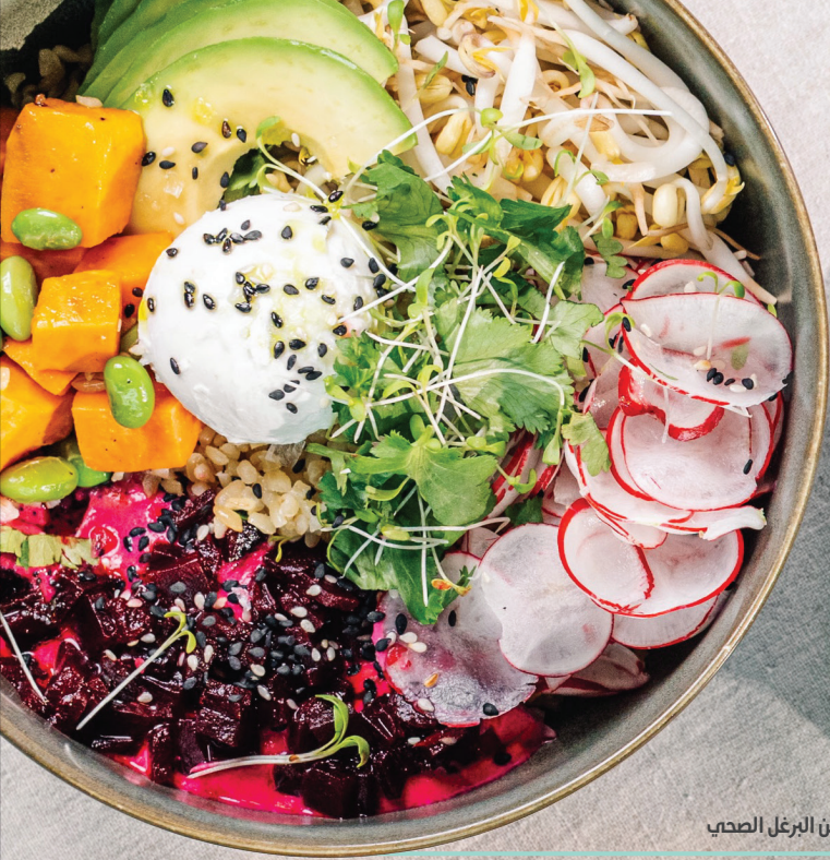
صحن البرغل الصحي