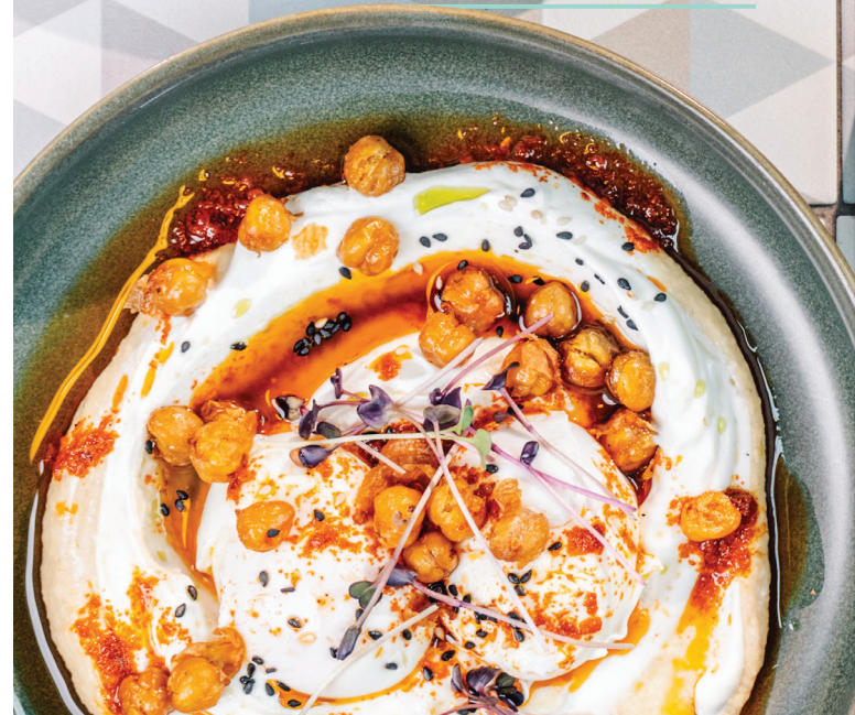
لبنة وحمص مع بيض مسلوقة