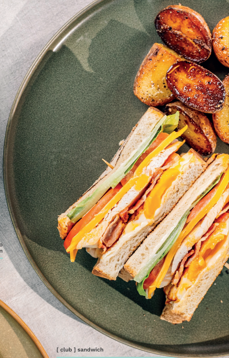
[ club ] sandwich