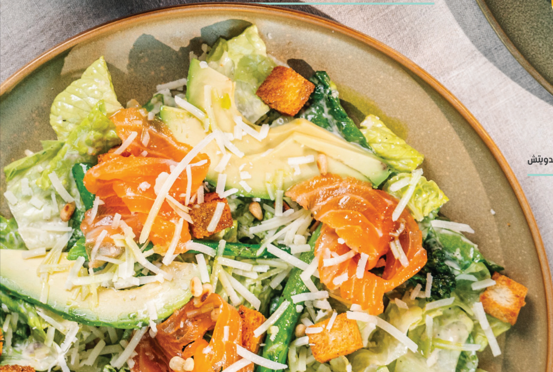
سلطة سبزر أفوكادو وسلمون مدخن