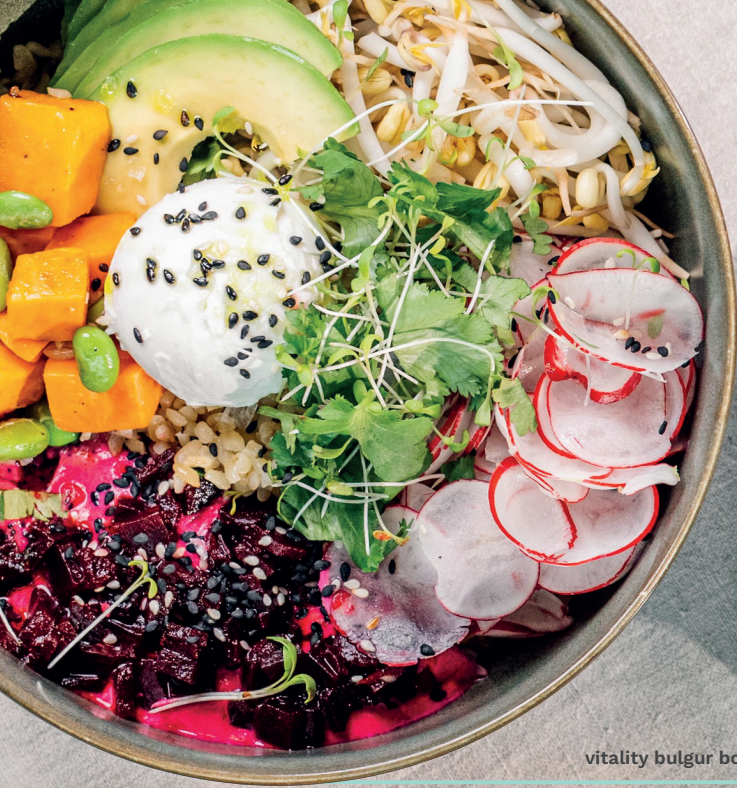
vitality bulgur bowl