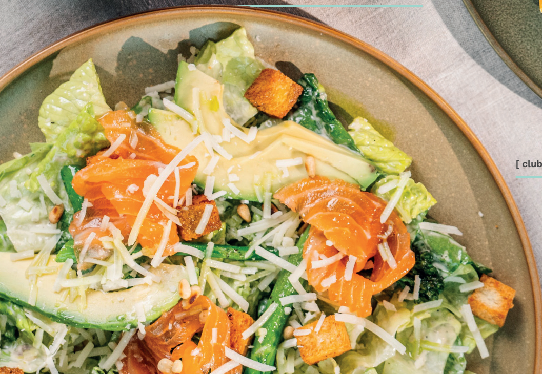
caesar salad avocado and smoked salmon