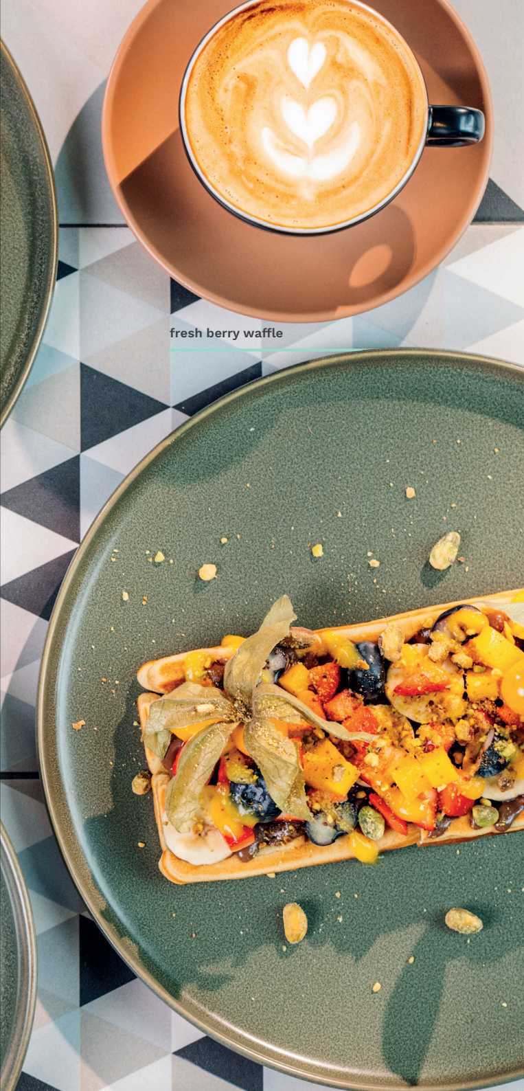
fresh berry waffle