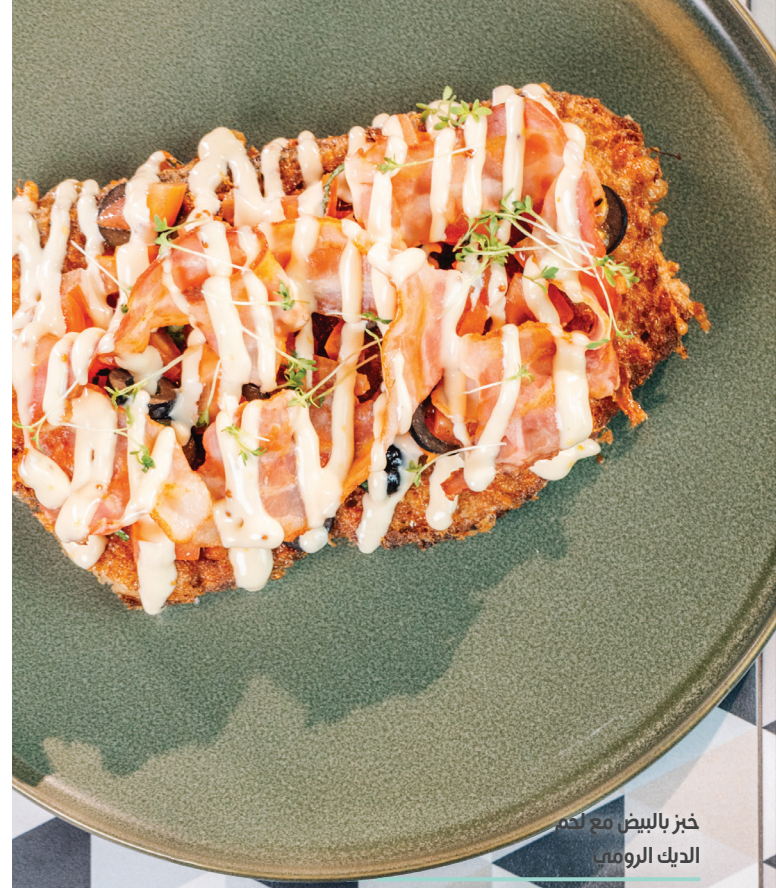
خبز البيض مع لحم الديك الرومي

لا تفوتك تجربة منتجاتنا اليومية من المخبوزات الطازجة والكرواسون والحلويات اللذيذة